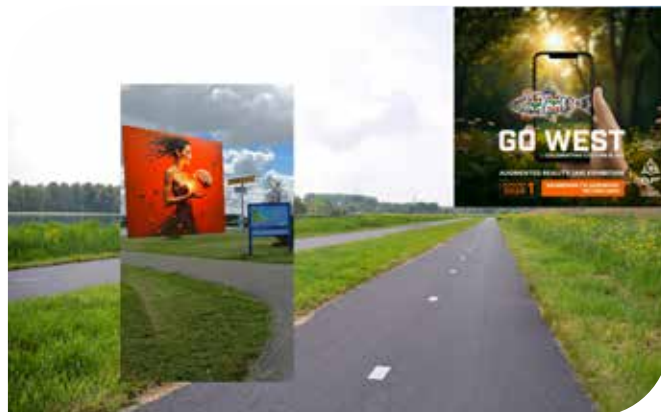
Kunst in het Krabbepark. Zo ziet één van de kunstwerken eruit als je de QR-code scant.

„Wellicht is het gebaseerd op de populaire animatie maar dit is geen spel maar een ontdekkingsreis,” weet Duifhuize. „Een tocht langs realistische kunst, niet moeilijk maar toegankelijk voor iedereen. Je kan de route in één keer afleggen maar er ook een aantal dagen over doen. We hebben toestemming van Staatsbosbeheer, de beheerder van het park, gekregen. Het gaat allemaal door, ben ik ontzettend content mee.”